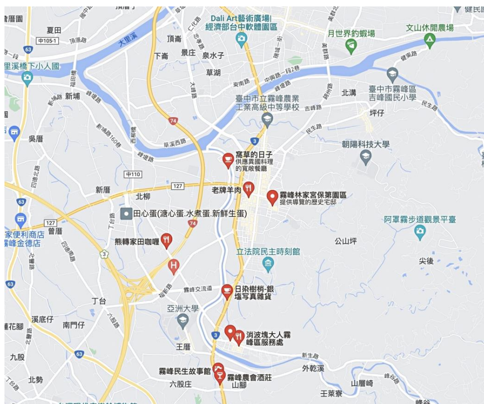
附圖一 承辦學校（臺中市立霧峰農業工業高級中等學校）位置圖